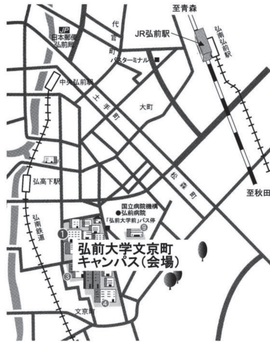
弘前大学文京町キャンパス構内図